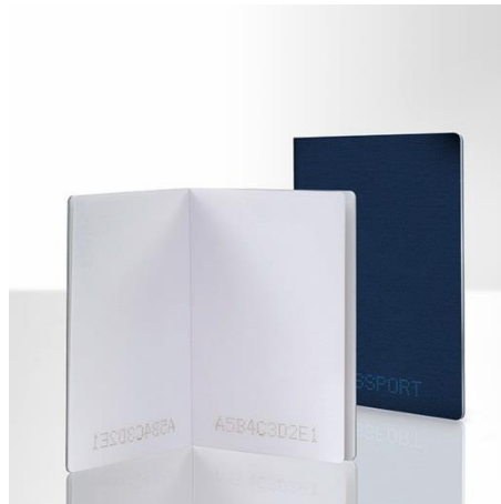
Lasermarkierung auf Papier: Reisepässe

Weitere Informationen sowie Text- und Bildmaterial erhalten Sie von: