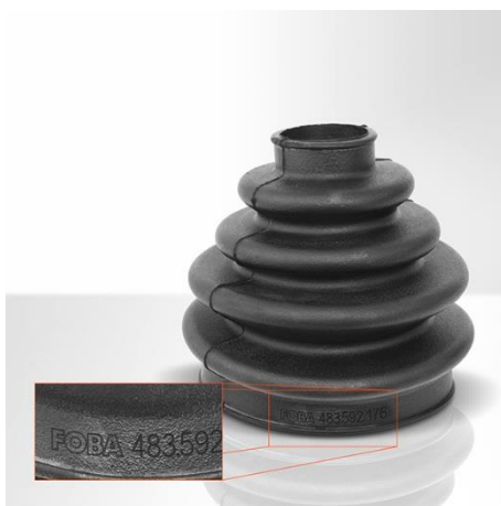
Automanschette aus Gummi

FOBA C.0102 und C.0302, 10- und 30 Watt-CO 2 -Lasermarkiersysteme der neuesten Generation, die ein weites Spektrum an Materialien mit flexiblen Inhalten markieren können.